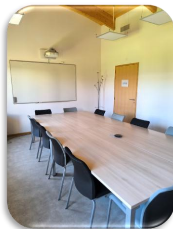
Salle Clain : 12 places