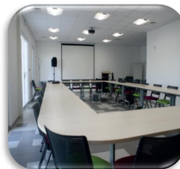
Salle de Lussac-Les-Châteaux

La salle est aménagée et équipée pour la tenue de réunions : mobilier confortable, écran, vidéoprojecteur, tableau, sonorisation ... L'établissement dispose d'une isolation phonique performante, une connexion internet gratuite.