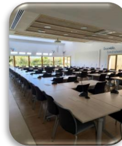
Salle Vienne : 80 places

La salle est aménagée et équipée pour la tenue de réunions : mobilier confortable, écran, vidéoprojecteur, tableau, sonorisation ... L'établissement dispose d'une isolation phonique performante, une connexion internet gratuite, un hall d'accueil, un espace bar et une salle de détente.