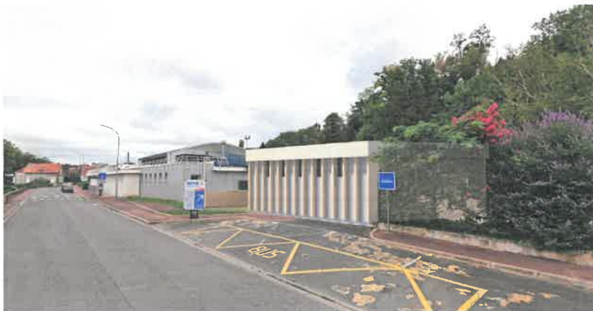
Vue de l'avenue Fernand Tribot : centre aquatique avec l'extension des locaux techniques